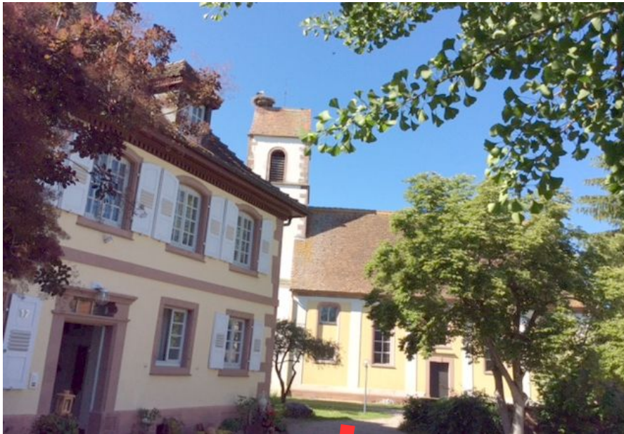
Bild: Evangelische Kirche und Pfarrhaus von Schallbach

Tagungsort: Evangelisches Gemeindehaus, Dorfstraße 17, D-79597 Schallbach